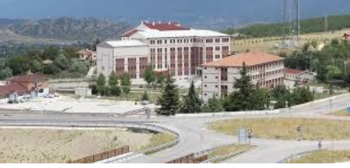
(Tosya Meslek Yüksekokulu)