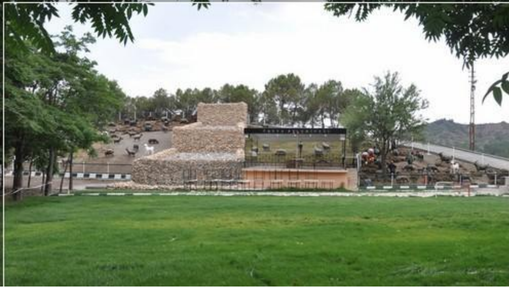
(Üçoluklar Mesire Alanı)

Bu nüfus, 19.327 erkek ve 20.589 kadından oluşmaktadır. Yüzde olarak ise: %48,42 erkek, %51,58 kadındır.